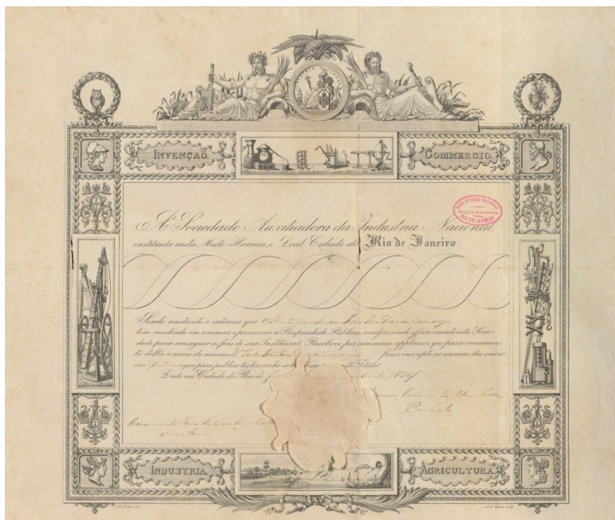
Figura 1 - Sociedade Auxiliadora da Industria Nacional.

Fonte: DEBRET, Jean Baptiste. Sociedade Auxiliadora da Industria Nacional. litograv, 38,2 x 40cm em papel 42,2 x 49,5cm (3 cópias). Biblioteca digital luso-brasileira. Disponível em https://bdib.bn.gov.br/acervo/handle/20.500.12156.3/44478 . Acesso em: 18 mar. 2021.