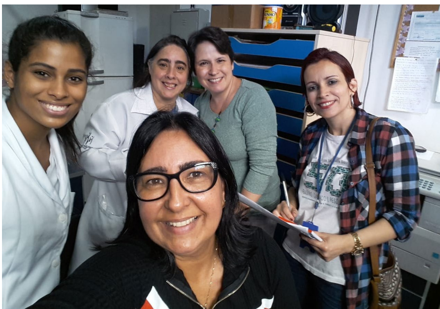
Atividade de planejamento do PSE na Creche Chico Bento.

Nos últimos tempos o grupo do O Manguinho tem dialogado sobre problemas de saúde que prejudicam o aprendizado dos alunos nas escolas nesse território. Para ajudar nessa conversa, trazemos aqui algumas informações que podem contribuir no enfrentamento desse problema.