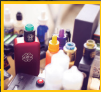
ELIQUIDS - UIC-8R19UZEI-FO-UNSP/LASH

A pesquisadora do Cetab alerta para a forte relação entre o tabagismo e o desenvolvimento de câncer. De acordo com a pesquisadora, 30% dos casos de câncer no Brasil estão relacionados ao consumo de