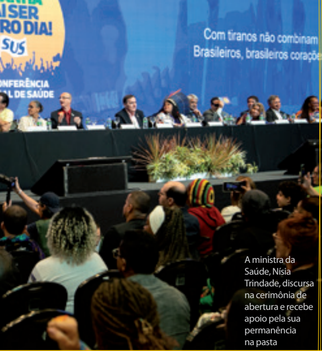
A ministra da Saúde, Nísia Trindade, discursa na cerimônia de abertura e recebe apoio pela sua permanência na pasta

nos”, disse ele. O financiamento adequado é o destaque da introdução da Resolução do CNS. “Nesse contexto, a revogação das regras fiscais constitucionais e legais que restringem o financiamento das políticas sociais foi reiterada, especialmente as que estabelecem tetos de despesas para o desenvolvimento de ações e serviços de saúde, na perspectiva de que saúde não é gasto, mas sim investimento. Não há economia sem vida, e não há vida sem garantia de saúde para toda a população como um direito humano”, diz o documento.