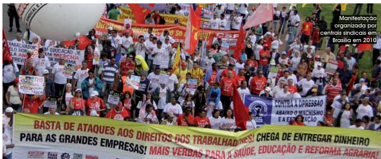
Manifestação organizada por centrais sindicais em Brasília em 2010