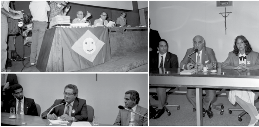
Câmara dos Deputados