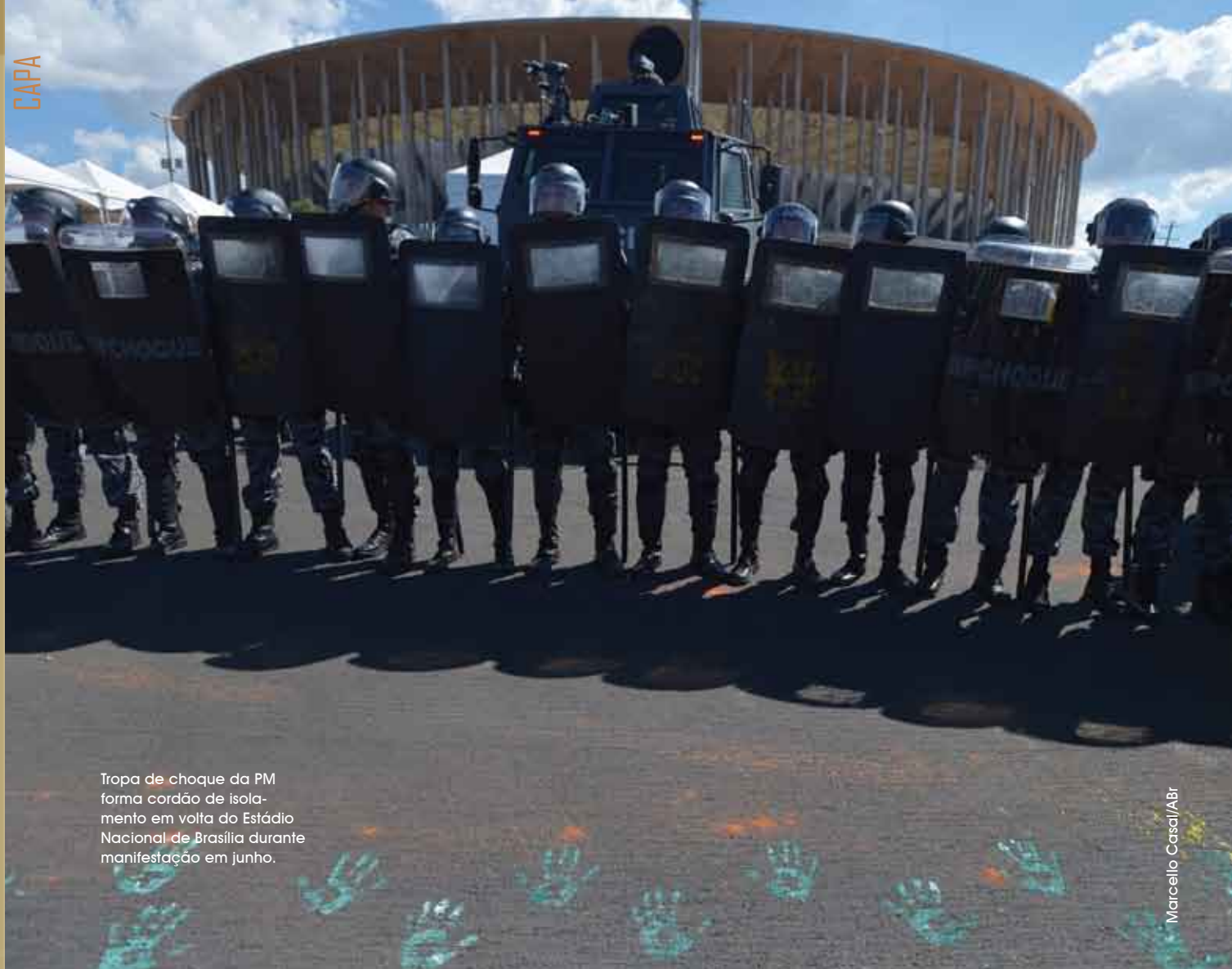
Tropa de choque da PM forma cordão de isolamento em volta do Estádio Nacional de Brasília durante manifestação em junho.