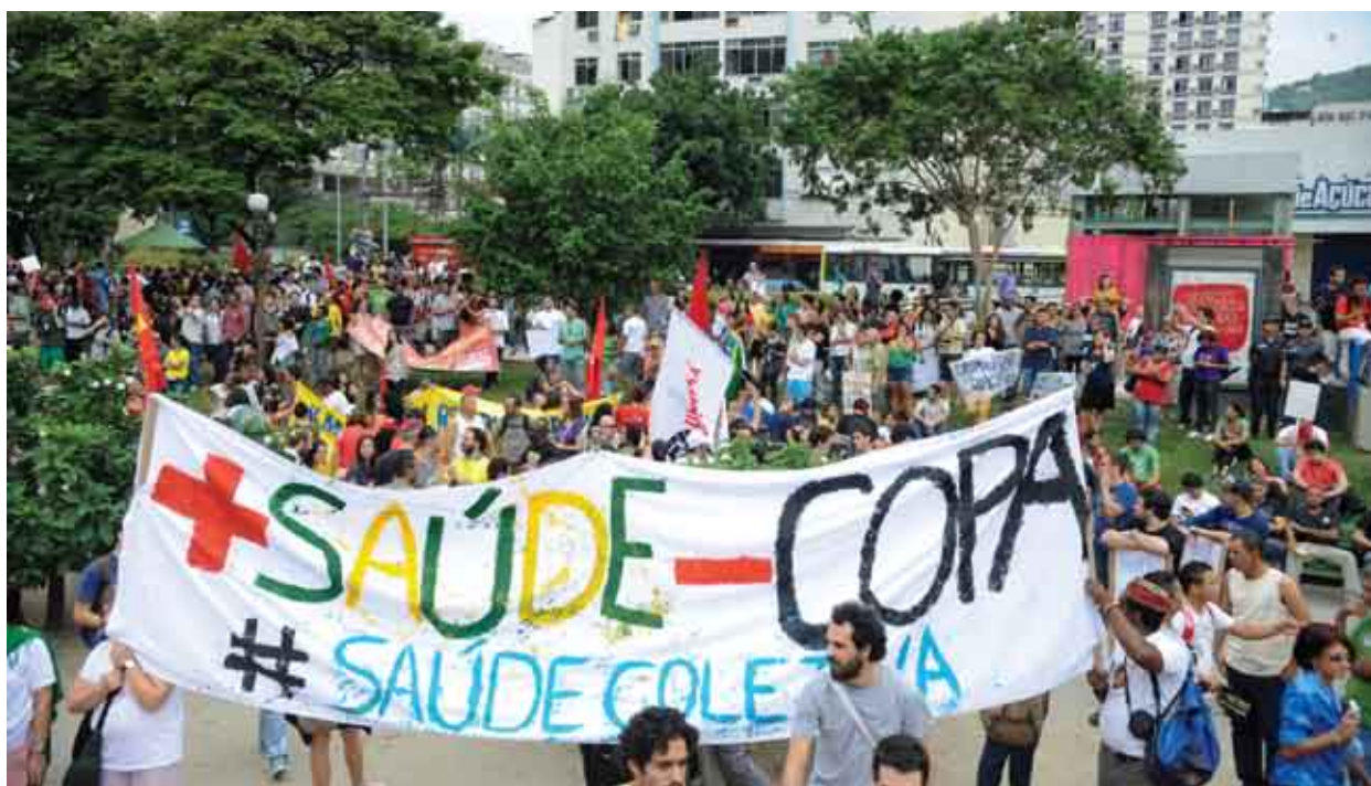
Manifestação no Rio de Janeiro no dia da final da Copa das Confederações.