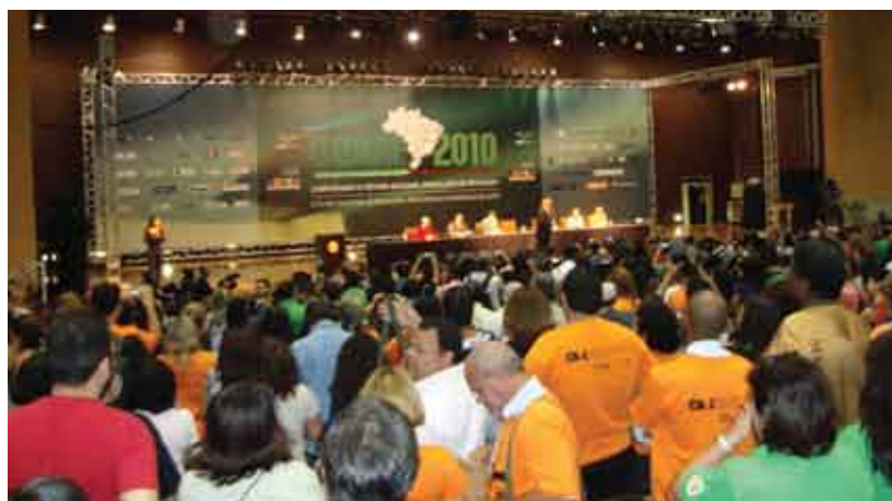
1ª Conae: delegados decidem que convênios com instituições privadas de educação infantil devem acabar

“ E m respeito ao princípio do recurso público para a escola pública, o número de matrículas em creches conveniadas deve ser congelado em 2014, e essa modalidade de parceria deve ser extinta até 2018, tendo que ser obrigatoriamente assegurado o atendimento da demanda diretamente na rede pública”. Essa é uma das decisões da 1ª Conferência Nacional de Educação (Conae), realizada em 2010. A preocupação dos delegados era com os convênios que municípios de todo o país estabelecem com instituições privadas sem fins lucrativos – filantrópicas, confessionais ou comunitárias – como forma de ofertar o acesso público à educação infantil.