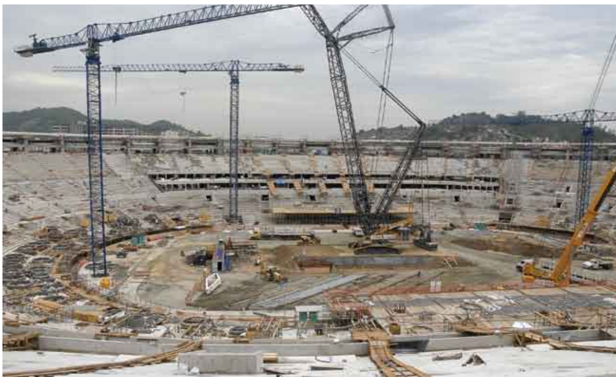
Reforma do Maracanã custou aos cofres públicos R$ 1,2 bilhão, 70% a mais do que previsão inicial.

constrói um estádio fora da cidade?”, indaga, e completa: “Natal e Cuiabá são as outras cidades que terão que construir novos estádios para a Copa de 2014 no Brasil. Após o evento, os estádios ficarão à míngua de público e sustentabilidade financeira para se manterem, porque não há clubes desses estados (RN e MT) nem na segunda divisão do campeonato brasileiro”.