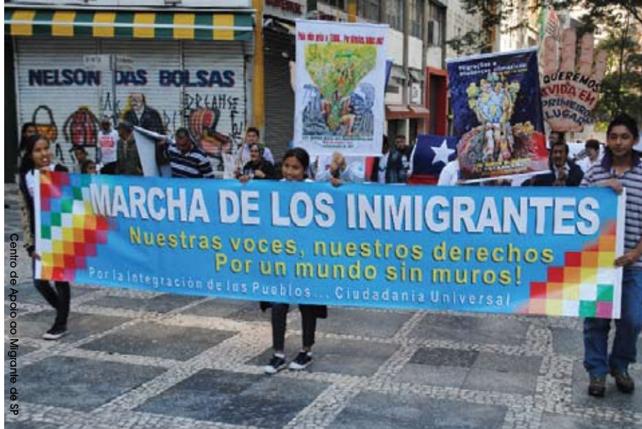
Imigrantes sul-americanos fazem manifestação na capital paulista para marcar o Dia do Migrante.

O Estatuto também estabelece a divisão de competências de