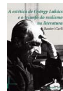
A Estética de György Lukács e o triunfo do realismo na literatura Ranieri Carli UFRJ, 2012, 207p.