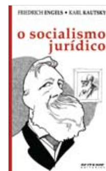
O Socialismo Jurídico Friedrich Engels e Karl Kautsky Boitempo, 2012, 80 p.