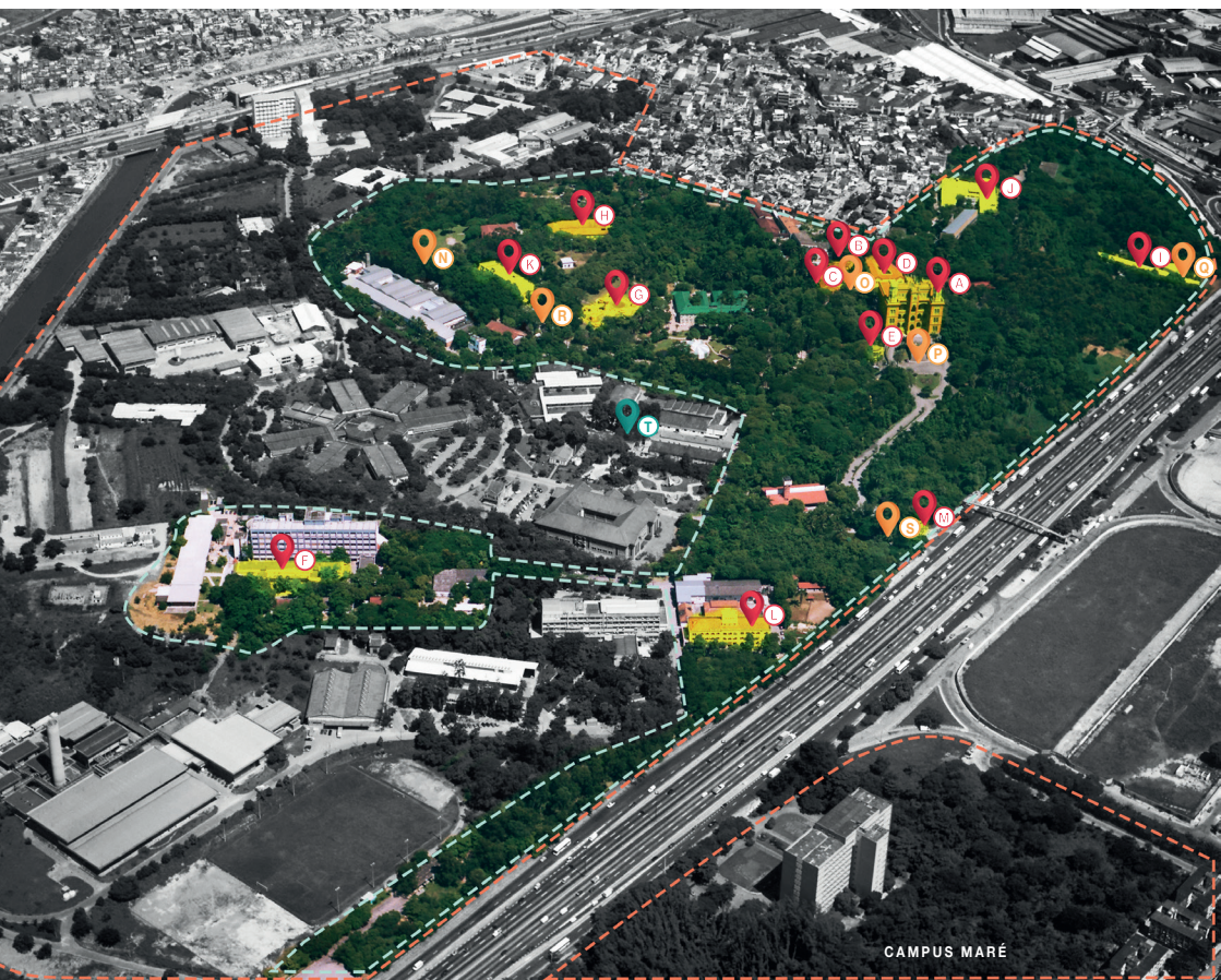
Vista aérea do Campus Flocruz Maré-Manguinhos.