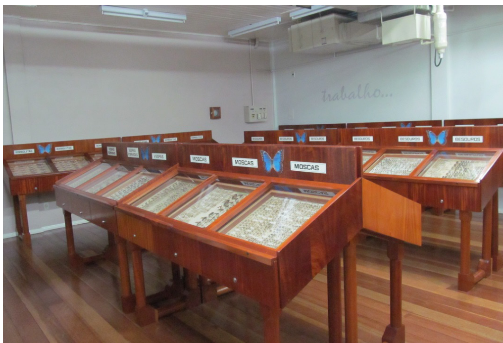
Foto 04: Sala que abriga a coleção entomológica no Museu Entomológico Fritz Plaumann.

Na imagem abaixo podemos visualizar uma das salas que abrigam a coleção entomológica.