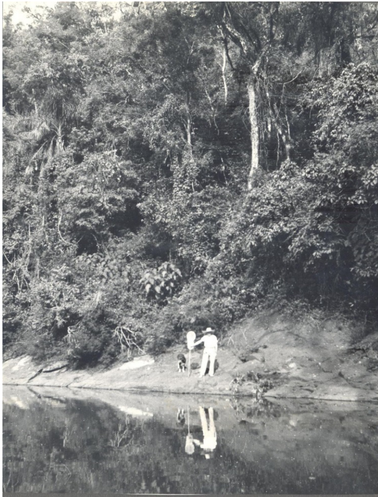
Foto 01: Fritz Plaumann coletando insetos, década de 1930, na Região do Alto Uruguai Catarinense.

Na imagem abaixo podemos visualizar um pouco do trabalho de coleta de insetos, observamos uma das principais áreas de coleta, a beira dos rios