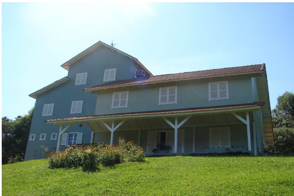
Foto 06: Museu Entomológico Fritz Plaumann.

Além disso, as exposições das coleções abrigadas nos Museus serviam para divulgar e levar para a população o conhecimento sobre o mundo natural. Este é o cenário do Museu Real, posteriormente denominado Imperial e Nacional, nas primeiras décadas do século XIX, e que acabou por se disseminar através do país, com a criação do Museu Paranaense Emilio Goeldi em 1866, Museu Botânico do Amazonas em 1883, Museu Paulista em 1894, o Museu Rocha, por iniciativa particular, criado no Ceará em 1887. No século XX, com a criação das universidades, cada vez mais foram surgindo iniciativas de criação de museus de história natural.