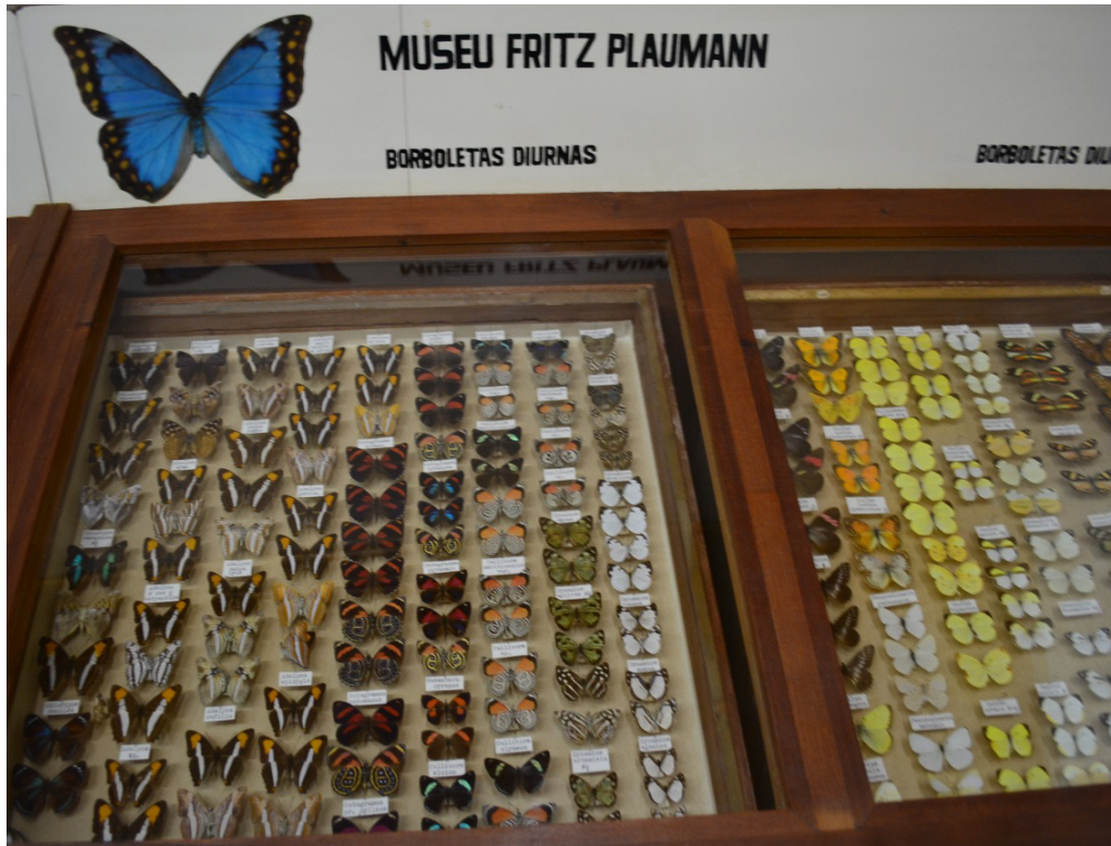
Foto 05: Coleção de lepidópteros do Museu Entomológico Fritz Plaumann.

No caso da coleção entomológica de Plaumann, foram erguidas paredes