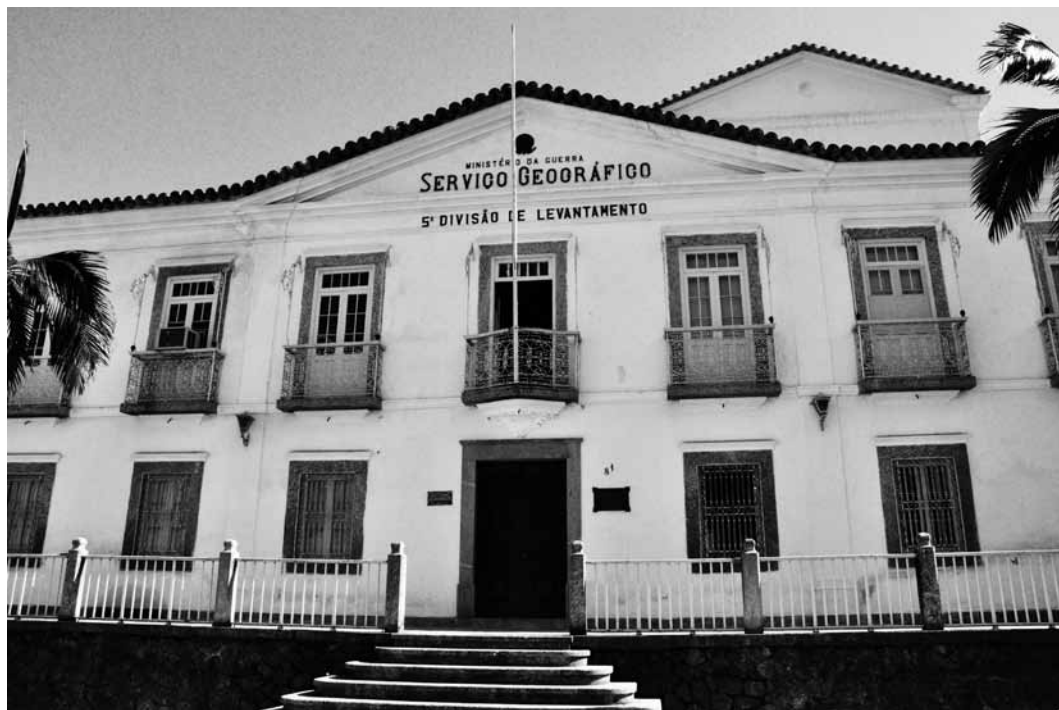
Fachada do prédio principal da 5ª Divisão de Levantamento do Serviço Geográfico do Exército.

Muitos conhecem ou já ouviram falar do morro da Conceição, situado no município do Rio de Janeiro. Em meio ao processo de revitalização da zona portuária da cidade, o local pode ser considerado privilegiado, pois abriga inúmeros marcos emblemáticos para a história da cidade e, até mesmo, do Brasil: o Observatório do Valongo, instalado no morro desde a década de 1920, erguido em um terreno conhecido anteriormente por ser um mercado de escravos; a Pedra do Sal, onde encontramos a Comunidade Remanescente de Quilombos da Pedra do Sal, um dos pontos de referência da cultura negra; o Palácio Episcopal da Conceição construído em 1634, abrigo, entre 1702 e 1905, da residência do bispo do Rio de Janeiro e por isso recebeu este nome; e a Fortaleza da Conceição erguida para ser um dos pontos estratégicos de defesa da cidade após a invasão da região por corsários franceses ocorrida em 1711. Os dois últimos locais citados, atualmente, abrigam a 5ª Divisão de Levantamento (5ª DL) do Serviço Geográfico do Exército, espaço que será analisado a partir de agora.