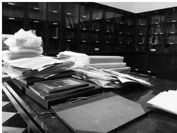
Documentação localizada na 5ª Divisão de Levantamento do Serviço Geográfico do Exército.