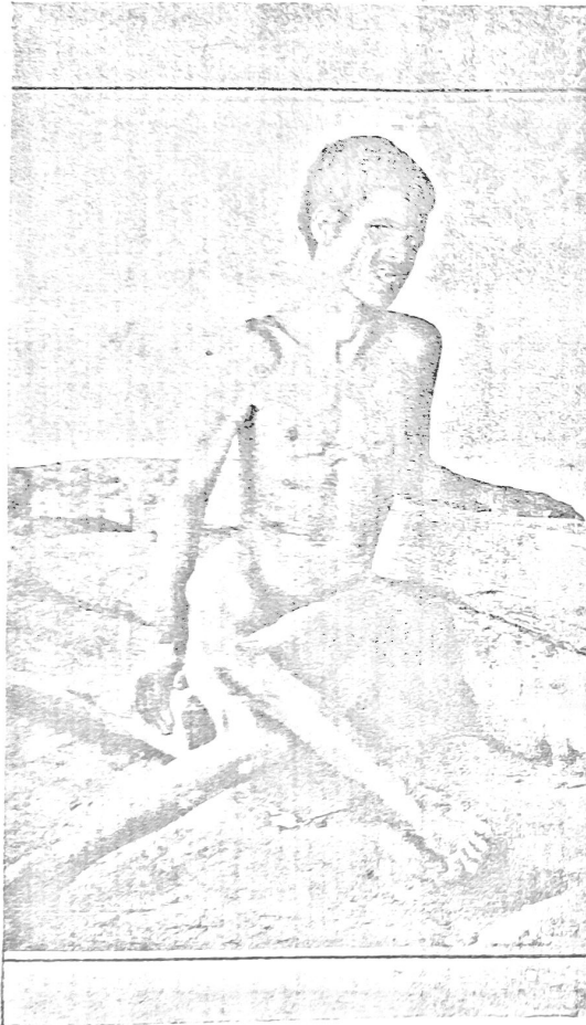
Forma nervosa — Diphlegia cerebral antiga — Idiotia completa

A interpretação deste facto que poderia fazer crer, á primeira vista, numa predisposição da infancia á molestia, é de grande facilidade e de toda a evidencia; nas zonas rurais infectadas todos os domicilios, pela presença nelles de insectos e de