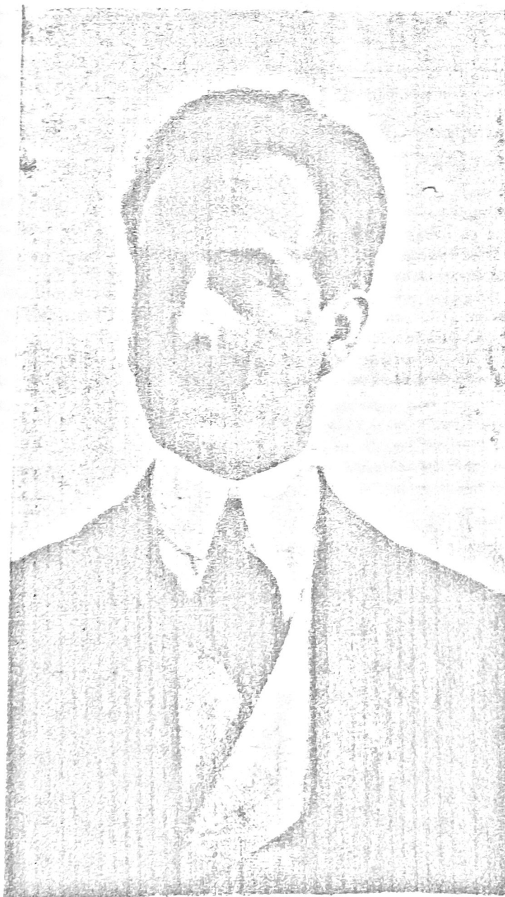
DR. CARLOS CHAGAS

Dr. Carlos Chagas — Permutas — Productos Pharmaceuticos — Memoranda.