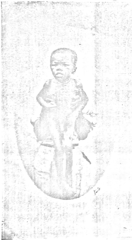
Fôrma nervosa — Syndromo de Lithe — Autopsiado

Em regra os infantes nessa molestia são tambem idiotas completos; casos existem porém em que nelles só encontramos leve grau de deficiencia mental. O que impressiona é a grande abundancia dos casos de infantilismo, constituindo-se deste modo