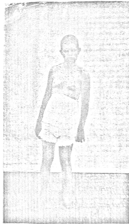
Forma nervosa - Diplegia cerebral - Idiotia completa

poder-se-ha bem comprehender o curioso aspecto das alterações do ritmo cardiaco nesta molestia, aspecto bem diverso, nas suas modalidades, do que é observado em miocardites attribuíveis a outros factores ethiologicos: entretanto, de peculiar aqui só