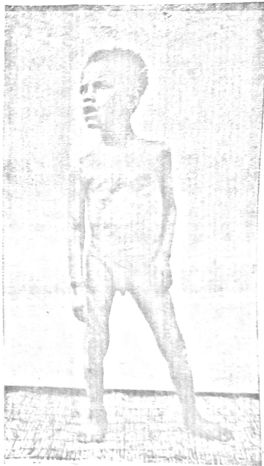
Fôrma nervosa — Diplegia cerebral

latas e aqui, entre a causa e o effeito bem facil se apresenta a ligação; aqui, dos dominios da pathologia, há de resultar grandes ensinamentos para a physiologia normal. Incidiremos, seduzido pela innovação, nos exageros lembrados? Seria admissivel esta