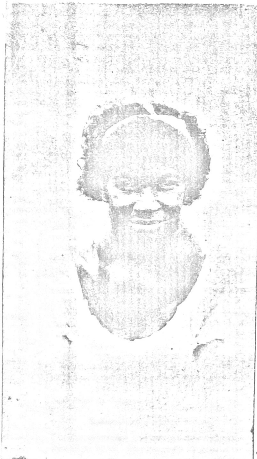
Forma cardíaca - Volumoso bocio - Autopsia

O barbeiro como o denominam no interior de Minas Geraes, conhecido ainda pelas denominações vulgares de chupão e de fiacio, é um hemiptero do genero