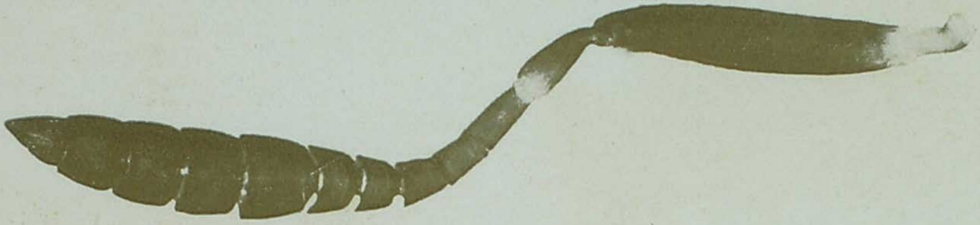
Fig. 1—Antenna da ♀ de Hadronotus brasiliensis .