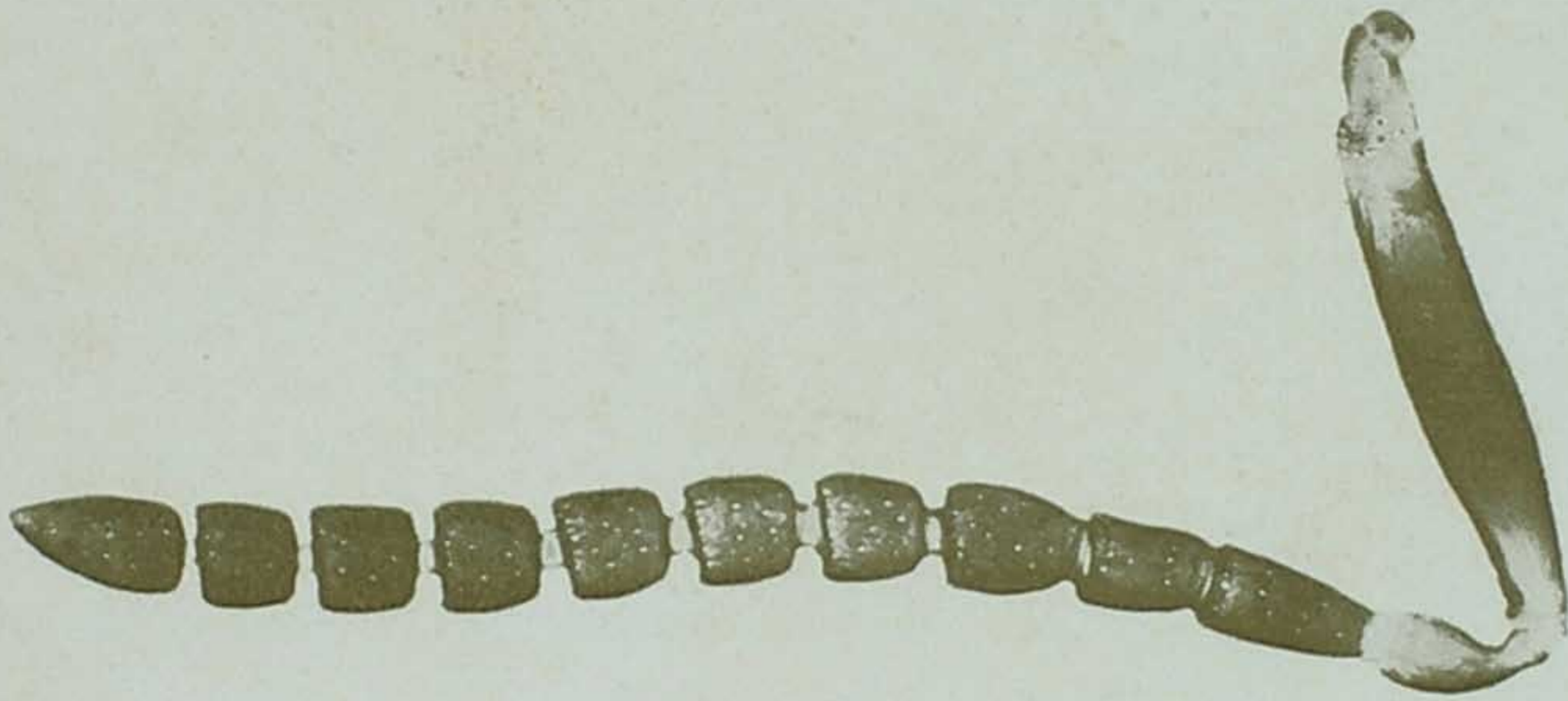
Fig. 2—Antenna do ♂ de Hadronotus brasiliensis .