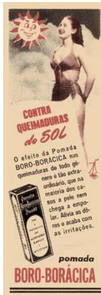
Figura 7 Figuras ilustrativas dos almanaques. Em 1906, o laboratório Daudt lançou o Almanaque A Saúde da Mulher , que atingiu tiragens históricas de 1,5 milhão de exemplares e circulou até 1974. O almanaque era parte da estratégia de lançamento do tônico Saúde da Mulher e acabou marcando várias gerações de mulheres. Além de anunciar os produtos e dar dicas para o universo feminino, os almanaques continham piadas, calendários, aconselhamentos, passatempos, etc. (BRASIL, 2008, p.29).