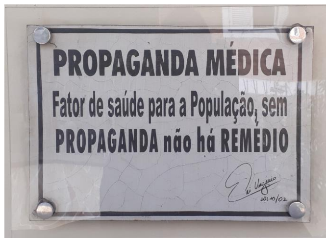
Figura 11 (Foto da entrada no Simproverj)