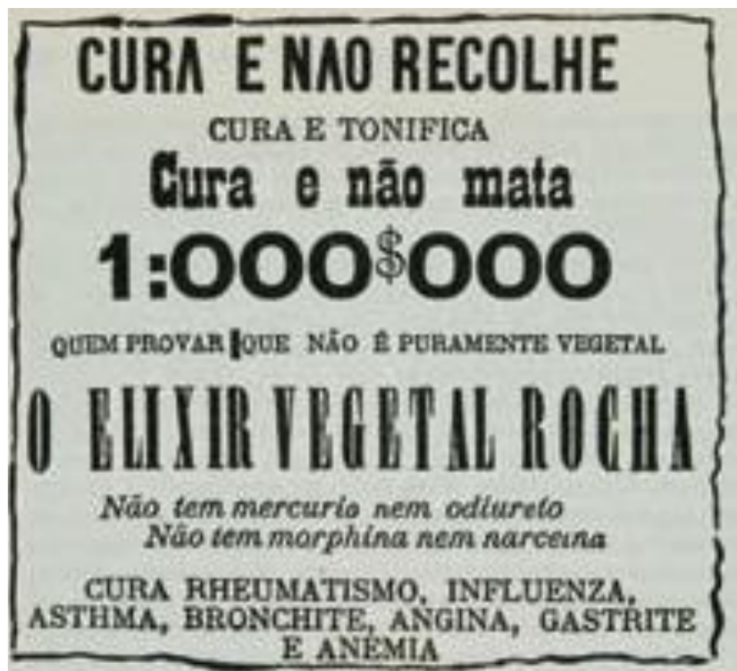
Figura 1 Cura e não mata: anúncio do Elixir Vegetal Rocha, publicado no Jornal do Comércio do Rio de Janeiro, em 1875.

Reproduzido do livro Sobrados e Mucambos (Gilberto Freyre, Rio de Janeiro: Livraria José Olympio Editora, 1981) (BRASIL, 2008, p.19).