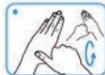
7. Esfregue os dedos polegares.