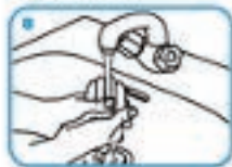
9. Enxágue as mãos com água.