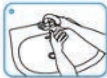
1. Molhe as mãos com água.

Cada lavagem deve durar pelo menos 20 segundos e deve ser feita com frequência