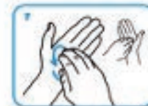
8. Faça movimentos circulares nas palmas das mãos.