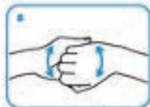
6. Feche as mãos e esfregue os dedos.