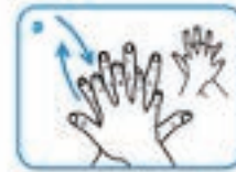
4. Coloque a mão direita sobre a esquerda e entrelace os dedos. Faça a mesma coisa com a mão esquerda sobre a direita.