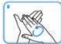
3. Esfregue as palmas das mãos.