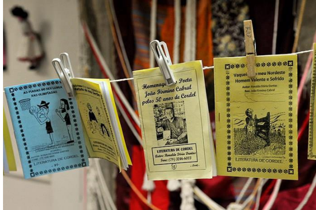
Figura 4: Literatura de Cordel.

Disponível em: http://www.sergipeturismo.com/literatura-de-cordel-em-sergipe/