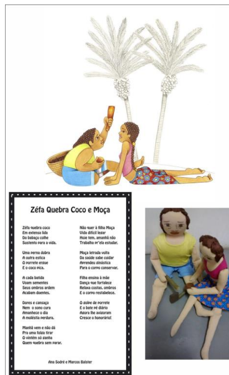
Figura 5: Zefa Quebra Coco e sua filha Moça, desenho, versão final (2017), autor Marcos Balster; Cordel narrando a história dos personagens (abaixo à esquerda), autores Ana Sodré e Marcos Balster e as personagens como bonecas de pano (abaixo à direita).

E assim, inspirados nas figuras de barro e na literatura de cordel, tão comuns à arte popular brasileira, foram criados o argumento geral e o concept art das personagens, Zefa Quebra Coco e sua filha Moça (Figura 5), para a participação no PARLA! 2017 e seu emprego nesse estudo.