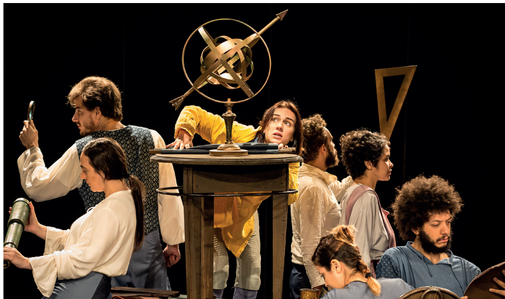
▲ Cena de A vida de Galileu, de Bertold Brecht, em montagem do Museu da Vida. Temporada de 2016.