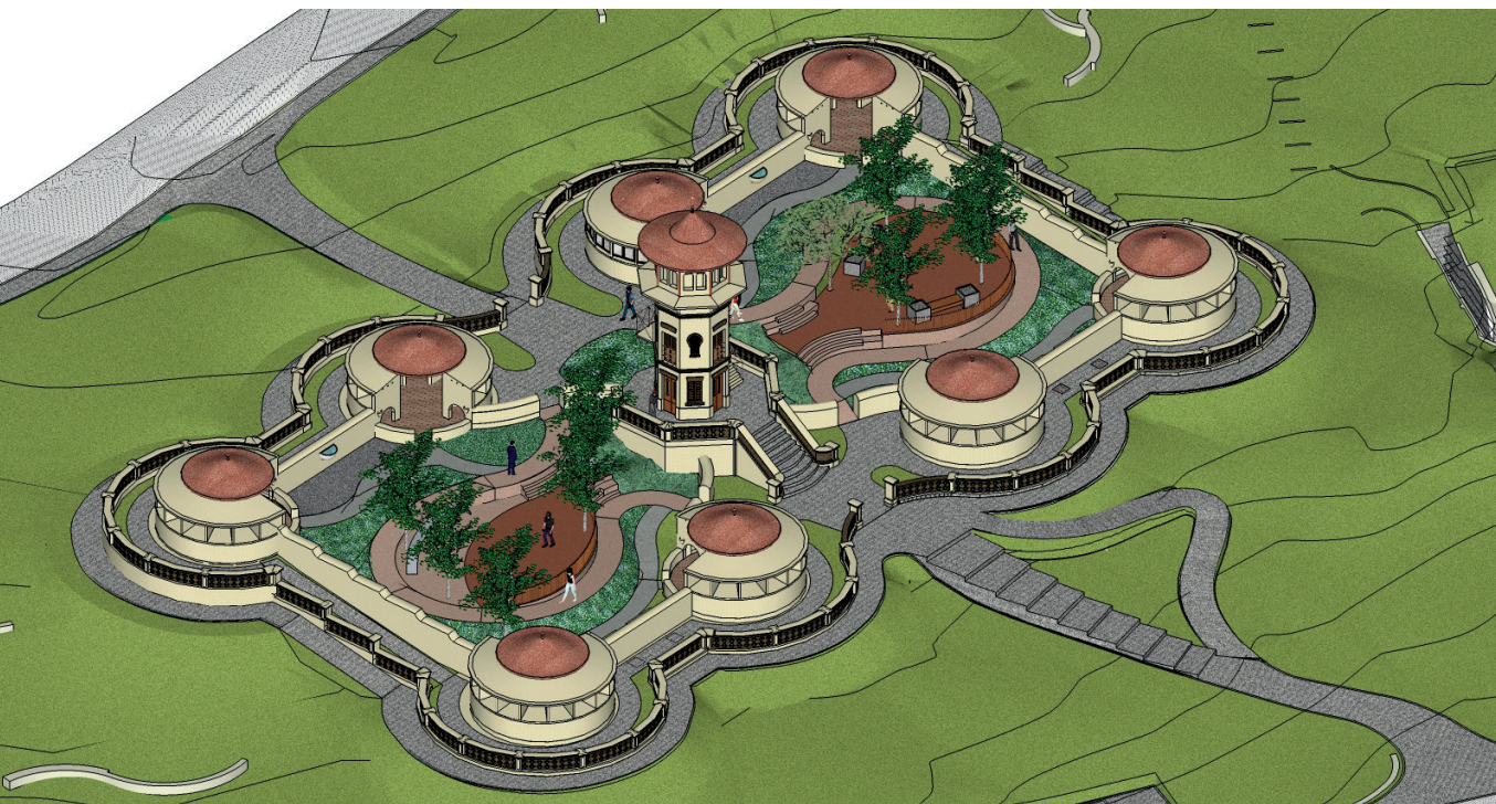
▲ Representação digital da revitalização do Pombal, segundo o projeto NAHM.

Nísia Trindade, em entrevista concedida em 2015