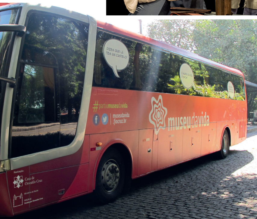
▲ Expresso da Ciência, ônibus gratuito criado para facilitar o acesso dos estudantes de escolas públicas ao Museu da Vida.

Em 2017, o Programa Amigos do Museu da Vida chega ao seu terceiro ano, tendo permitido até aqui a expansão das receitas totais diretas do Museu da Vida em aproximadamente 25%. Seu carro chefe é o Expresso da Ciência, que vem atuando de forma a mitigar dificuldades de mobilidade urbana na cidade do Rio de Janeiro ao trazer ao Museu, em um ônibus próprio, alunos de escolas públicas, sobretudo de áreas favelizadas. Além disso, o programa já permitiu a renovação de áreas expositivas e de equipamentos do Museu e a montagem de novas peças teatrais no âmbito do Ciência em Cena, em particular de “A Vida de Galileu”, de Bertolt Brecht, em 2016, grande sucesso de público e crítica.