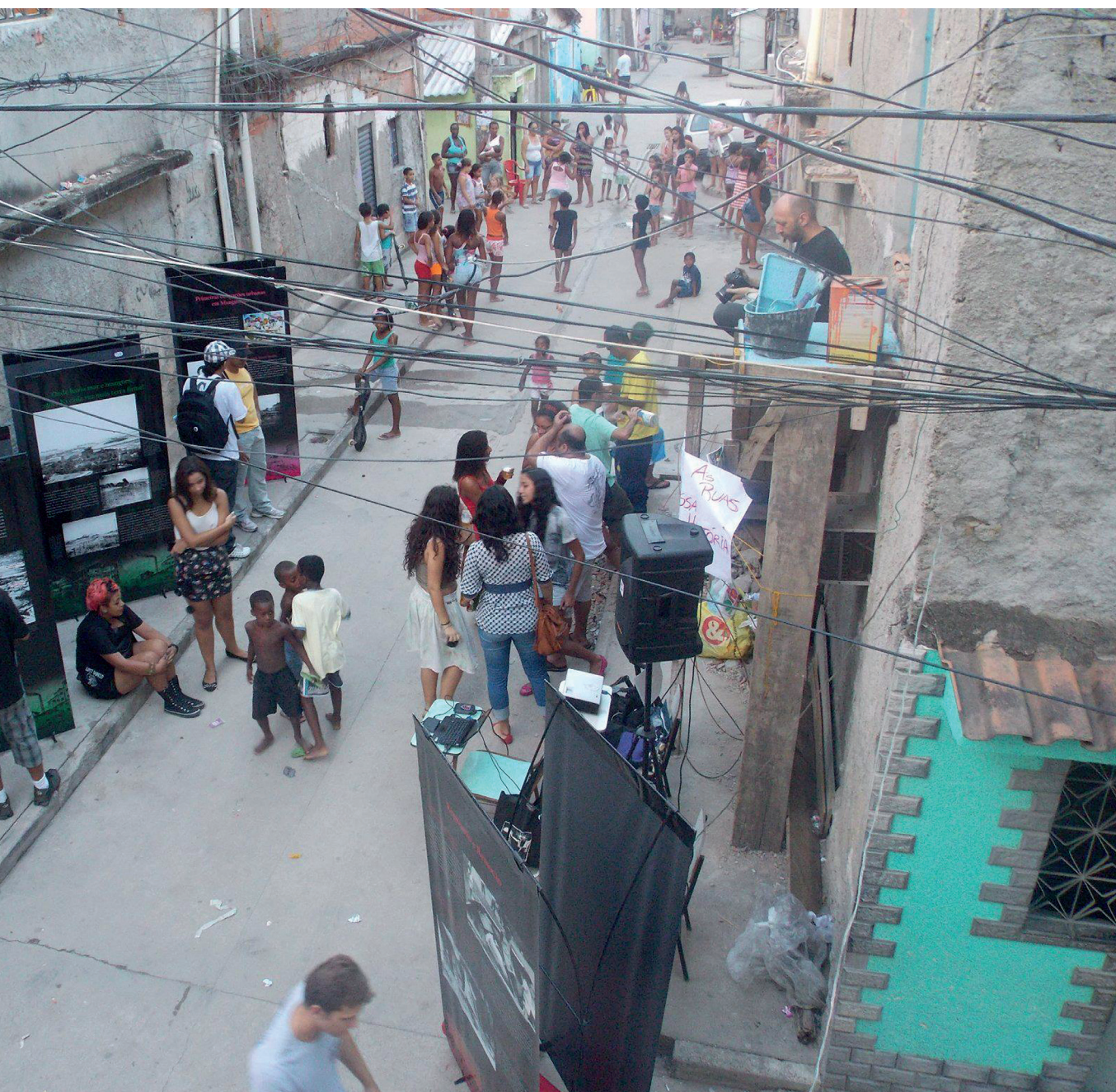
▲ Público visita a exposição "Território em Transe" em uma rua do Parque João Goulart, Manguinhos.