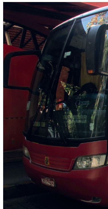
Alunos do Programa de Iniciação à Produção Cultural aceitam o convite proposto pelo Expresso da Ciência.