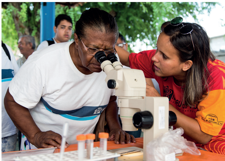
▲ Alunos do Ceja (Centro de Ensino de Jovens e Adultos), na Maré, participam de oficina sobre dengue, zika e chikungunya.

A partir dessas ações, o Museu da Vida busca não apenas dar atenção à região em que está inserido, mas também desconstruir a ideia de uma cidade partida, promovendo o encontro e o diálogo entre desiguais. O Curso de Formação de Monitores, entre 1999 e 2011, foi uma das primeiras iniciativas realizadas nesse âmbito. Ao longo dos anos, surgiram outras ações, como o projeto Tecendo Redes, a exposição “Território em Transe”, o Expresso da Ciência, o Grupo de Ações Territorializadas e o Programa de Iniciação à Produção Cultural.