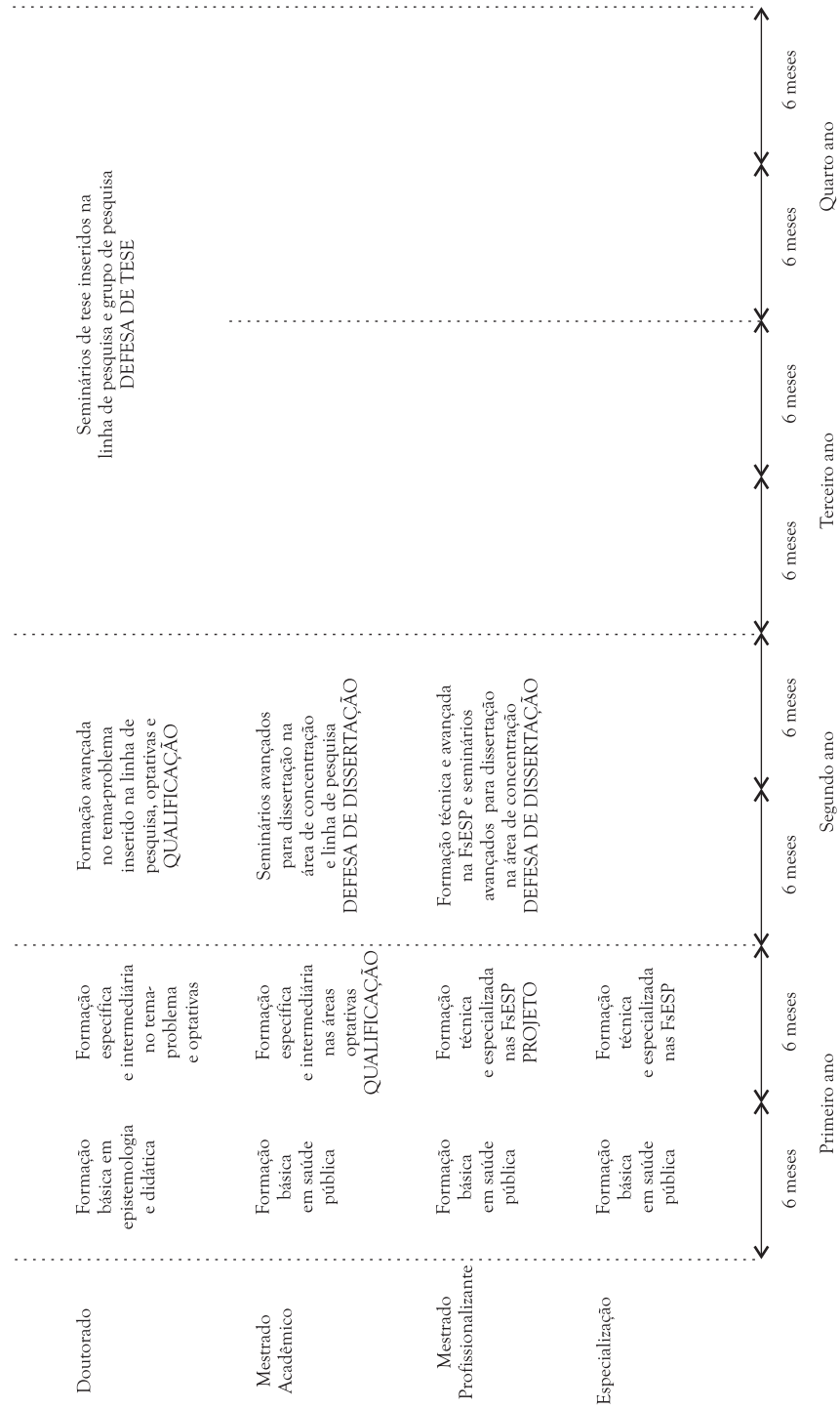
Figura 2 – Proposta de estruturação da Pós-Graduação