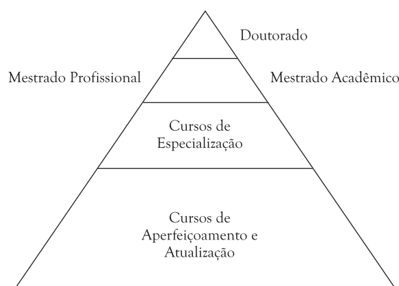
Figura 1 - Hierarquização da formação de profissionais para o Sistema Nacional de Saúde

des de formação, como líderes de pesquisa científica e docência (doutorado), jovens pesquisadores e docentes (mestrado acadêmico), quadros estratégicos e lideranças para as Funções Essenciais da Saúde Pública (FsESP) 4 (mestrado profissional), quadros especializados para as FsESP (especialização) e aperfeiçoamento e atualização de profissionais que atuam dentro e fora do setor Saúde.