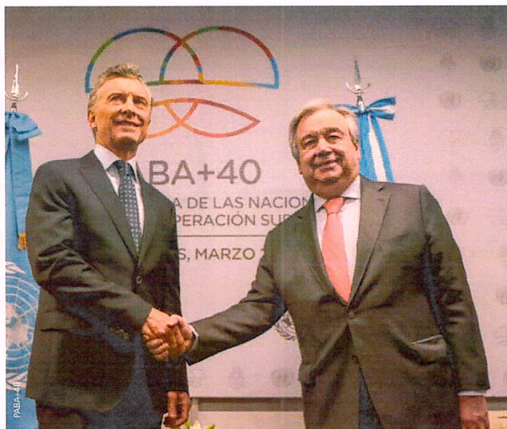
Maurício Macri, presidente da Argentina, e Antonio Guterrez, Secretário-Geral da ONU, cumprimentam-se na abertura do evento.

No tocante à superação da pobreza e da pobreza extrema, foram muito valorizadas as políticas públicas de transferência de renda condicionadas — a exemplo do Bolsa Família, do Brasil — mencionado em diversas oportunidades. Como organizar o programa, identificar destinatários adequados, monitorar e avaliar, além de garantir fonte estáveis de recursos, estiveram entre as preocupações e a busca de soluções dos países que pretendem implementar esta estratégia vencedora em diversos países em desenvolvimento. Medidas eficazes de