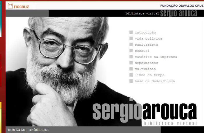
(Biográfica Sergio Arouca)