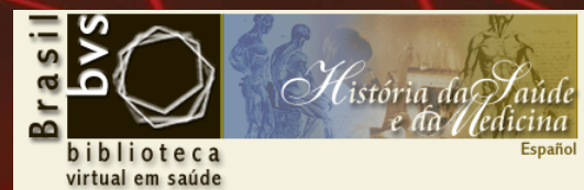
(História da Saúde e da Medicina)

Inicialmente, são seis as instâncias da BVS existentes na Fiocruz