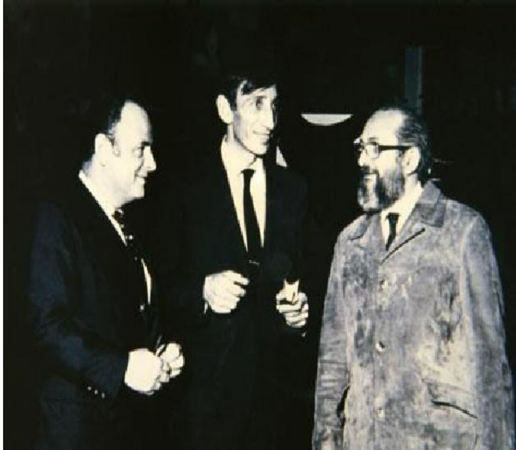
Figura 2: Paulo Freire ao lado do educador Ivan Illich, em Genebra

“Não sou apenas objeto da História, mas seu sujeito igualmente” (Freire, 2000, p. 83)