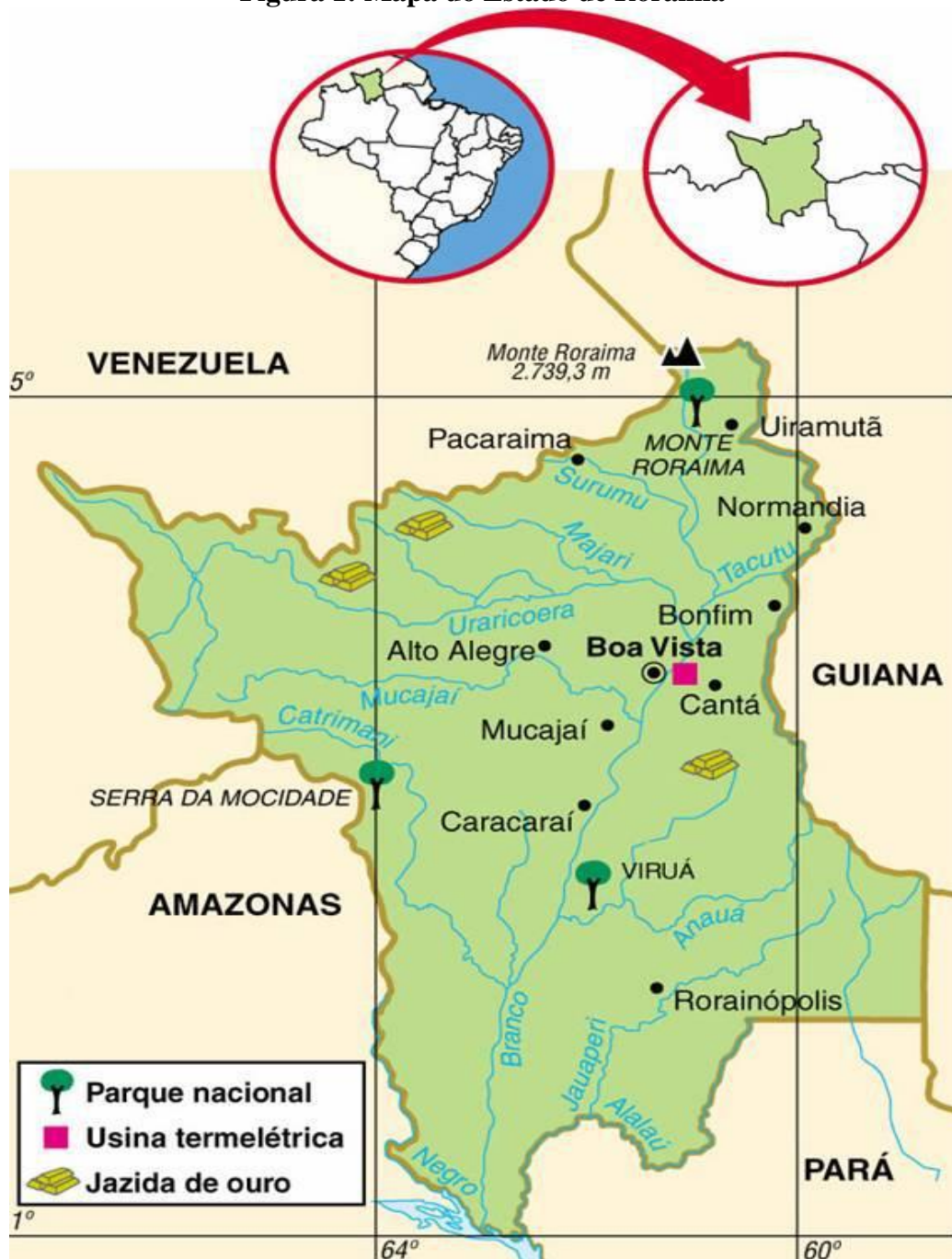
Figura 1: Mapa do Estado de Roraima