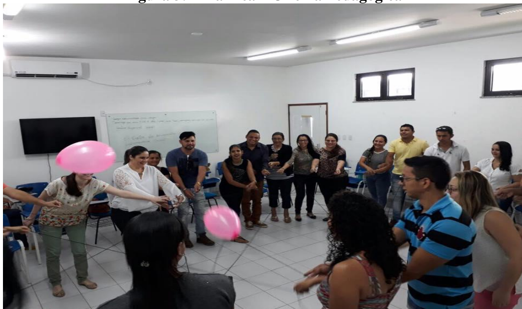
Figura 3: Dinâmica – Oficina Pedagógica

Continuando a discussão sobre a Formação dos Docentes da EPTNM em saúde apresentaremos como está organizada a Capacitação Pedagógica da ETSUS/RR. Nesta perspectiva, vamos procurar identificar a presença do pensamento de Paulo Freire.