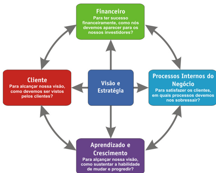
Figura 1 - Perspectivas do Balanced Scorecard baseadas na visão estratégica

As experiências do BSC se ampliaram de um sistema de medição de desempenho para um sistema gerencial de monitoramento de resultados da empresa e a identificação de processos estratégicos.