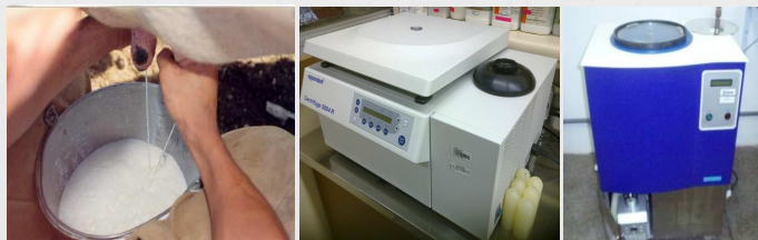
Figura 2. Coleta de leite cru, centrifuga e liofilizador

As amostras do lote foram organizadas em 4 suportes. Todo o lote foi desidratado por 24 horas em liofilizador da marca Liotop, modelo K105. Os parâmetros foram temperatura a 103° C e 92 µmHg de vácuo no final do processo. Os frascos foram lacrados e armazenados a -70° C.