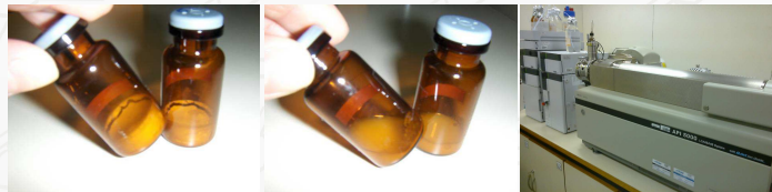
Figura 3. Leite em pó liofilizado e ressuspensão 11 , sistema LC-MS/MS

Para o estudo de homogeneidade foram utilizados 16 frascos escolhidos por amostragem aleatória estratificada. As amostras foram ressuspensas com aproximadamente a mesma quantidade de água perdida durante a liofilização. A extração dos analitos foi realizada pelo método QuEChERS (Quick, Easy, Cheap, Effective, Rugged, Safe), baseado na extração com acetonitrila e adição dos sais acetato de sódio e sulfato de magnésio, seguida da determinação da MON no leite pela técnica de Cromatografia Líquida de Alta Eficiência acoplada à Espectrometria de Massas Sequencial (LC-MS/MS). O método empregado é capaz de determinar resíduos de seis ionóforos polímeros em leite, incluindo a MON, e foi desenvolvido e validado por Pereira 8 , segundo o Procedimento Operacional Padrão 9 , que se baseia na Decisão 657/2002 10 . Os resultados foram avaliados estatisticamente pela análise de variância (ANOVA).