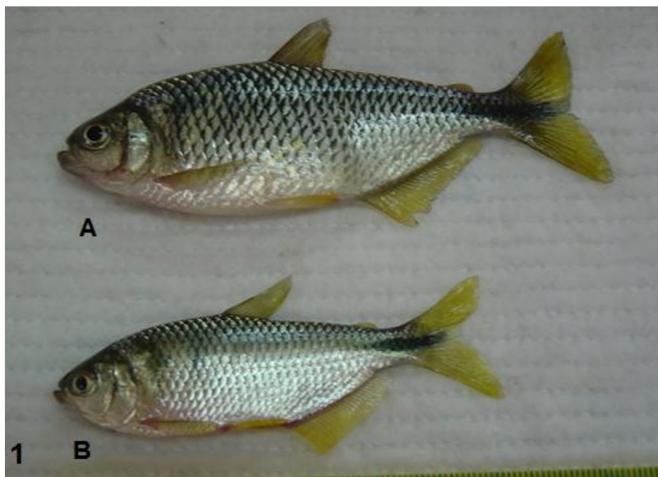
Figura 1 – Macho (A) e fêmea (B) de Astyanax altiparanae (Garutti & Britski, 2000).