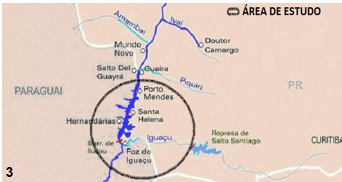
Figura 3 – Localização geográfica da área de estudo (inserida dentro do círculo – localização aproximada).

Os peixes mediam de 8,5 a 10,2 cm (média de 9,36 cm \pm 0,38) de comprimento total e 6,5 a 8,3 cm (média 7,43 \pm 0,38) de comprimento padrão e pesavam de 10 a 18 g (média 13,77 g \pm 1,87) e estavam sendo criados em tanques-rede de 4,5m 3 no rio Iguaçu – PR. As brânquias foram retiradas e colocadas em formalina 1:4000, agitadas e tiveram seu volume completado até 4%, procedendo assim à fixação dos parasitas. Em seguida foram transportadas ao Laboratório de Helmintos Parasitos de Peixes, do Instituto Oswaldo Cruz, Rio de Janeiro, sendo importante que os recipientes estivessem muito bem lacrados e organizados em caixas para que não fosse perdido nenhum material durante o transporte.