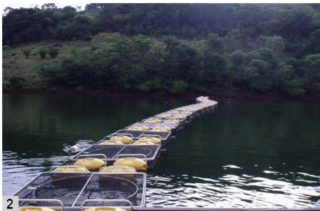
Figura 2 - Unidade demonstrativa de criação de peixes nativos em tanques-rede no refúgio biológico de Santa Helena - PR.