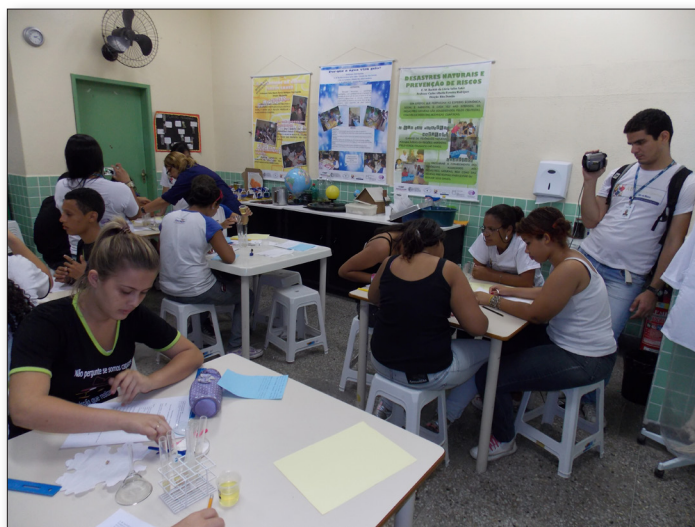
Fig. 1. Pesquisa etnográfica na “sala-ambiente”